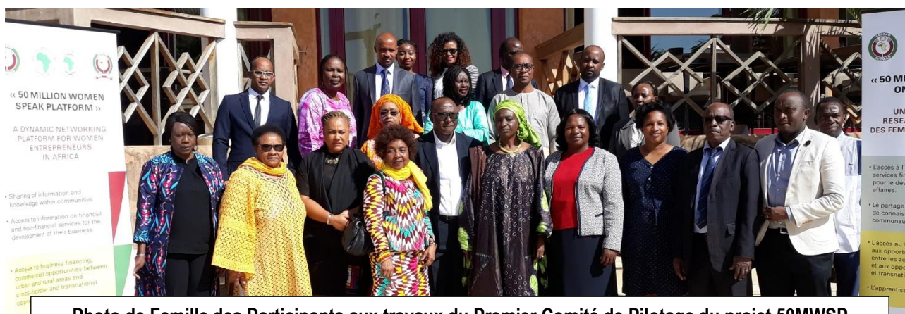
Photo de Famille des Participants aux travaux du Premier Comité de Pilotage du projet 50MWSP

Saly-Mbour, 05 Décembre 2018 – La CEDEAO, la Communauté Economique des Etats de l'Afrique de l'Ouest assure la présidence du Comité de Pilotage du Projet Continental « 50 Million African Women Speak Platform » pour une année. Le COMESA, le Marché Commun de l'Afrique Orientale et Australe assure la Vice-Présidence et l'EAC, la Communauté des Etats de l'Afrique de l'Est prend le poste de Rapporteur du Bureau du Comité de Pilotage. C'est l'une des résolutions issues des travaux de la première réunion du Comité de Pilotage de ce projet qui se sont tenus du 03 au 04 Décembre 2018 à Saly-Mbour en République du Sénégal.